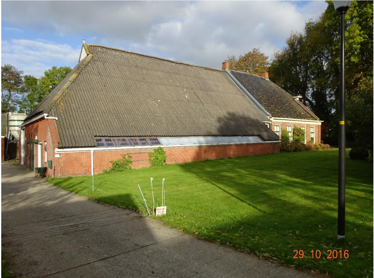
Pastorieboerderij in 2016, na herstel aardbevingsschade in 2015.

Het woord weem is de oude benaming voor de pastorieboerderij en komt uit het Middelnederlands en Oudfries wethem = dotatie aan de kerk of kerkgoed.