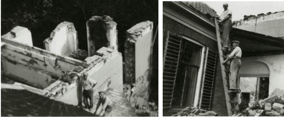
Afbraak van de weem in 1953