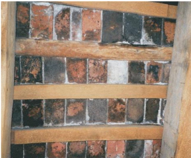
Wellicht was de zoldering van de studeerkamer van dit type.

1834 Den 26 April is er een nieuwe Zolder onder de Steenen Zolder op de Studeer-kamer gelegd: -