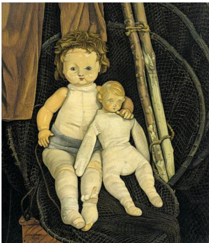
Schilderij van Jopie Huisman