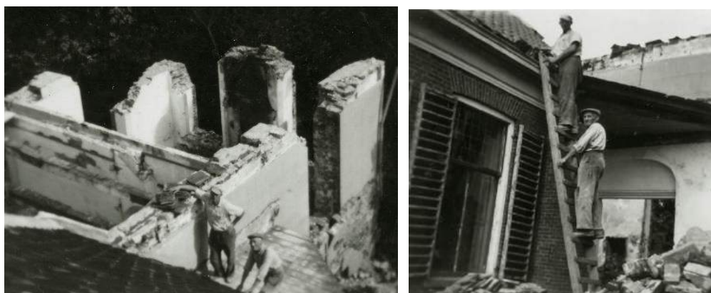
Afbraak van de weem in 1953