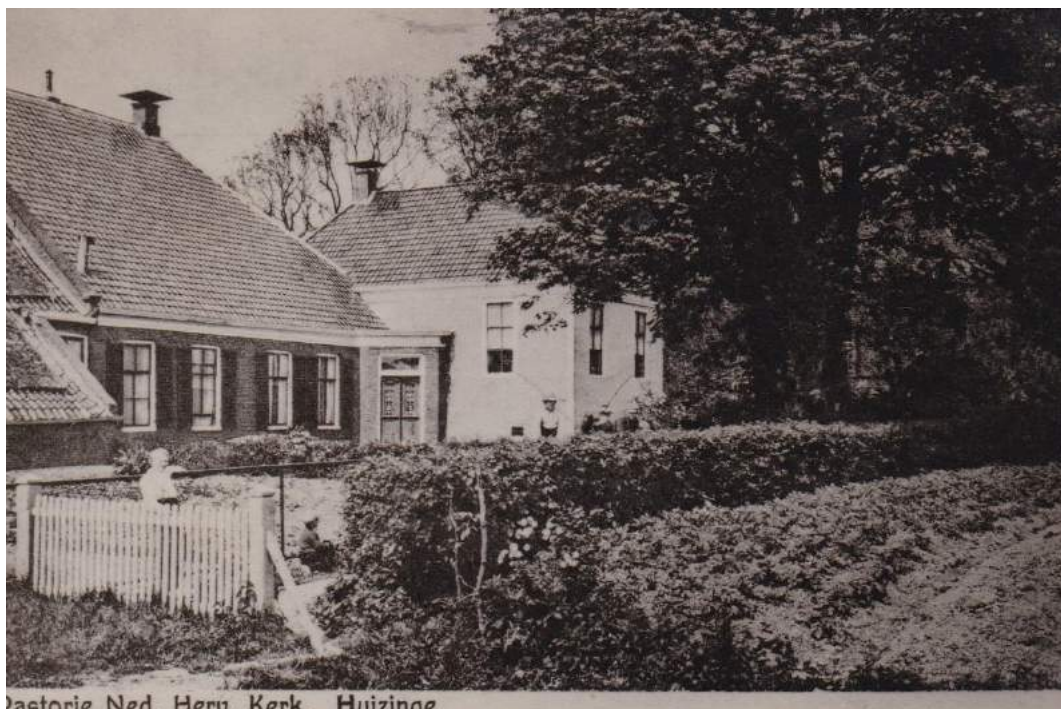
Pastorie Ned. Herv. Kerk. Huizinge