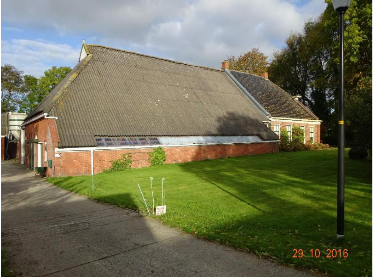
Pastorieboerderij in 2016, na herstel aardbevingsschade in 2015.

Het woord weem is de oude benaming voor de pastorieboerderij en komt uit het Middelnederlands en Oudfries wethem = dotatie aan de kerk of kerkgoed.