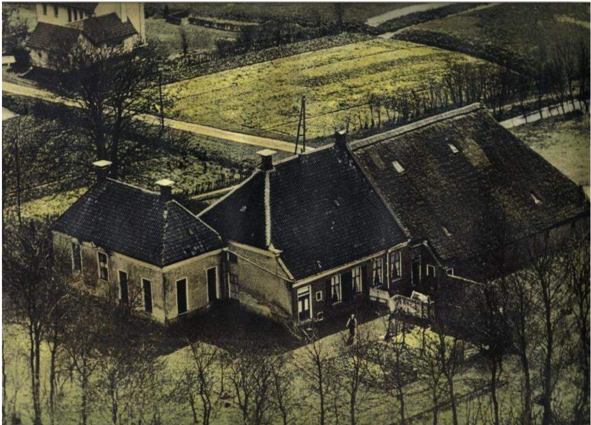
Middeleeuwse voorhuis afgebroken in 1953. Het middenhuis werd in 1858 gebouwd, verving een oud gebouw. Oude schuur werd in 1836 vergroot. In 1858 werd het oude gedeelte vervangen door nieuwbouw.